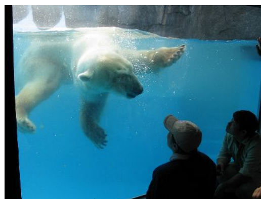
間近で見るホッキョクグマのダイブは大迫力