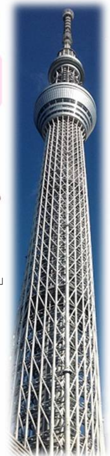
東京スカイツリーに “桜島大根”がやってくる

お問合せ 鹿児島市かごしまプロモーション推進室 東京分室 TEL 03-5226-5040 FAX 03-5276-7150