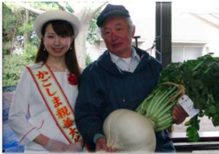
昨年の「世界一桜島大根コンテスト」の優勝大根は、重さ 18.34 kg 胴回り 104.0 cm

その世界一の桜島大根を“見て・触れて・味わう”体感イベントを東京で開催します。この機会に、雄大な桜島の魅力に触れてみてはいかがでしょうか。